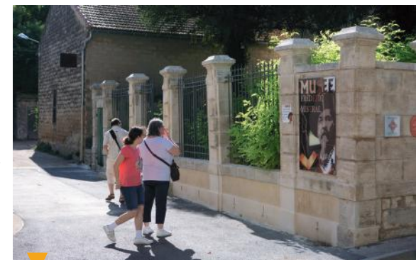
MUSÉE MISTRAL - MAILLANE