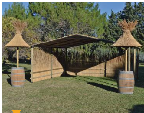
MISTRAL ENTREPRISES - ETS COMBE - MAILLANE

Chemin du Grenouillet - Petite Route d'Eyragues +33 (0)4 90 95 73 35 | +33 (0)6 09 36 07 60 combe-13.com Cette entreprise familiale depuis 3 générations, forte d'une expérience de plus de 60 années dans le domaine du roseau de Camargue, fabrique et distribue des paillassons utilisés à l'origine pour la protection des cultures contre le froid. Aujourd'hui, les temps ont bien changé, et d'autres utilités ont été trouvées, les paillassons en roseaux servent maintenant à couvrir les pergolas et autres tonnelles, ou faire des brise vue ou brise vent. Cette activité est complétée par la fabrication de parasols et paillettes de formes différentes.