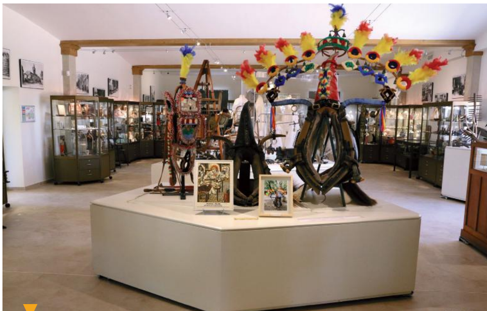
MUSÉE DU PATRIMOINE - EYRAGUES