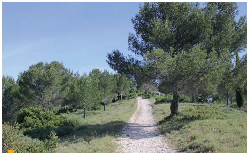
VALLON DE LA ROQUETTE - CHATEAURENARD

Balade en vignes à bord de notre Delage 1931, en matinée, en soirée, le temps d'une journée, ou plus selon votre gré, à la rencontre des vigneron, à la découverte d'un terroir, Les alpilles. Soirée vins et mets. Ateliers de dégustation vins, whiskies, thés et huiles d'olive, parcours sensoriel parents/enfants, cave de vente et de dégustation.