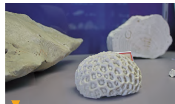
MUSÉE URGONIA - ORGON