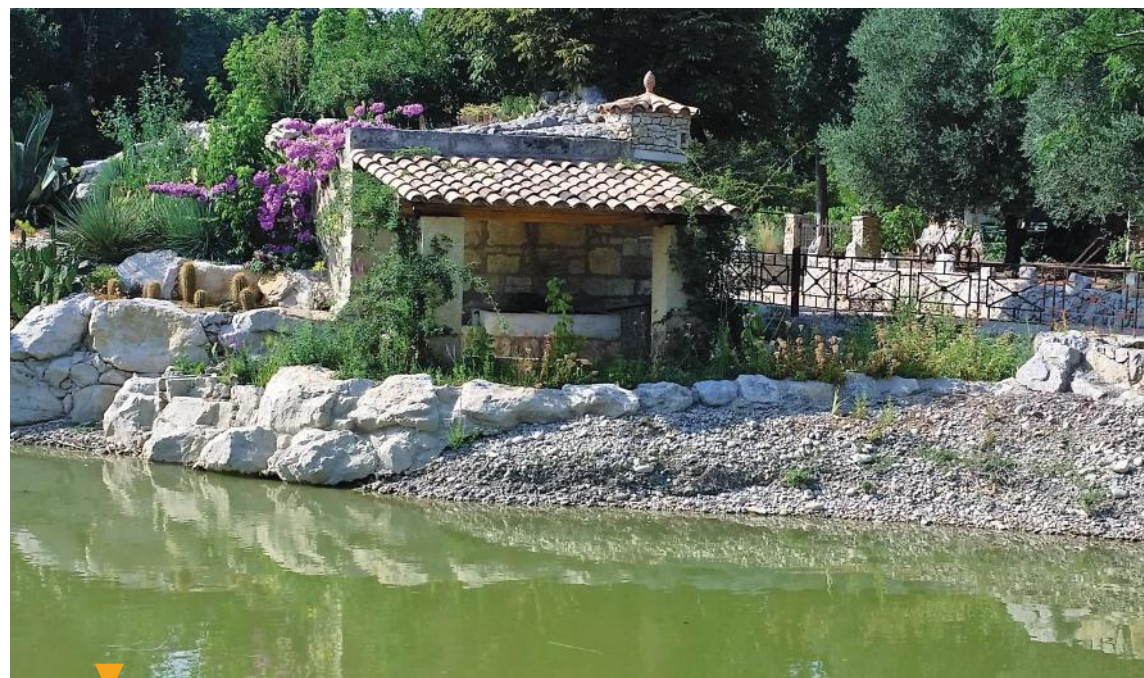
GRAVESON - JARDIN AQUATIQUE

Deux petits terrains où pratiquer de nombreuses activités sportives, à proximité du stade de rugby.