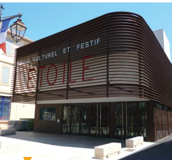
ESPACE CULTUREL ET FESTIF DE L'ETOILE - CHATEAURENARD

Depuis sa rénovation en 2012, la salle de l'Etoile accueille 1500 pers. lors de concerts et 771 pers. assises. A la salle de l'Etoile est venu s'ajouter le théâtre Pécout, qui offre un cadre plus intimiste avec ses 269 fauteuils. Fait rare, la salle a été intégralement rénovée en respect des normes de qualité environnementale et de performances énergétiques, ce qui lui a valu d'obtenir le niveau argent des bâtiments durables méditerranéens. Tout au long de l'année, ces deux salles accueillent des centaines de manifestations, salons, expositions, lotos, congrès, assemblées générales, concerts et spectacles associatifs etc. Rés. en ligne ou au service billetterie Culturel : +33 (0)4 90 24 35 02.