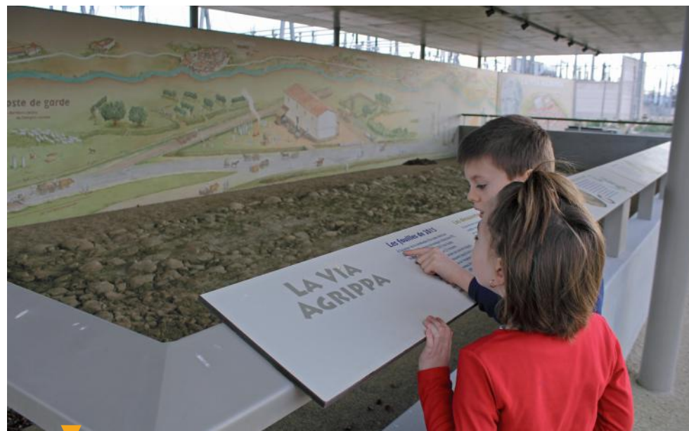
SITE ARCHÉOLOGIQUE - GRAVESON

Ces supports pédagogiques très documentés ont été conçus de façon ludique afin d'intéresser un vaste public, notamment les enfants.