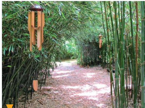
EYRAGUES - BAMBOUS EN PROVENCE

Situé au cœur de la commune, sur la colline du Griffon, le jardin des tours entoure le château médiéval