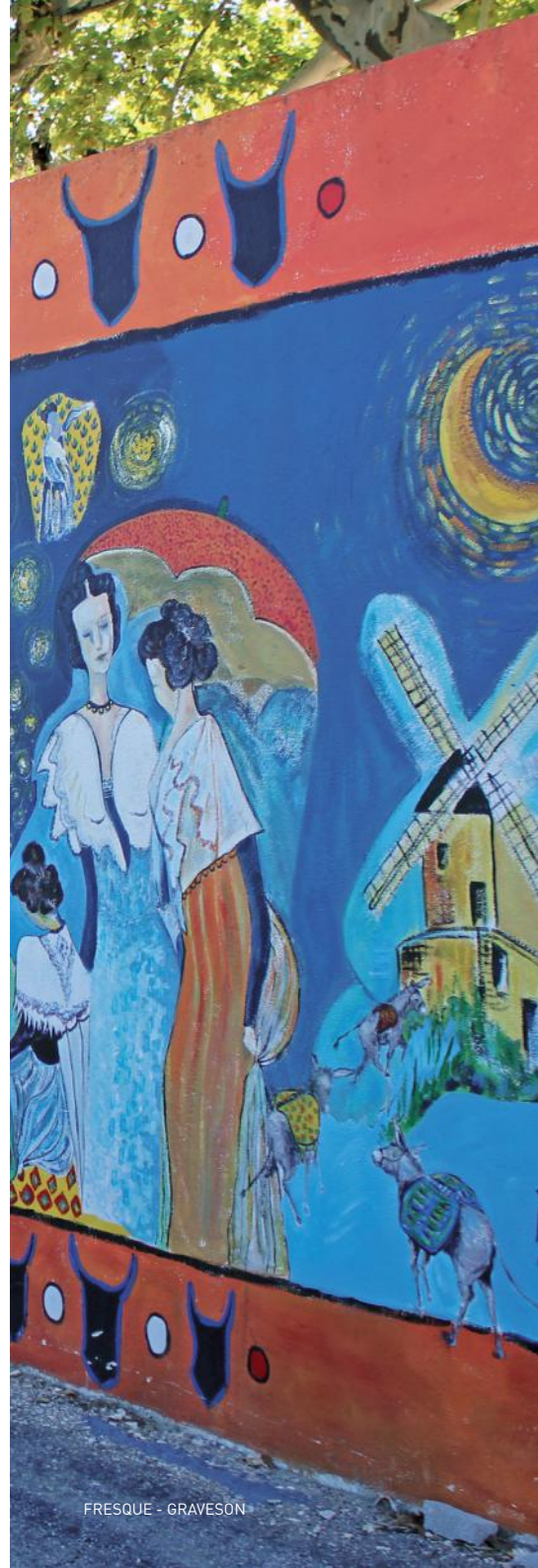
FRESQUE - GRAVESON

53 bis Cours National | +33 (0)4 90 95 81 65 murielmcreation@gmail.com | murielm.net Atelier de couture et création textile. Boutique cadeaux/ déco, impression sur tissu et porcelaine, flocage broderie, couture, retouches. Création d'articles d'ameublement et déco d'intérieur, d'accessoires vestimentaires (sac, trousse etc.). Tous nos produits sont conçus, imprimés, fabriqués, décorés sur place, personnalisation à la demande. Impressions sur T-shirt blancs et couleurs.