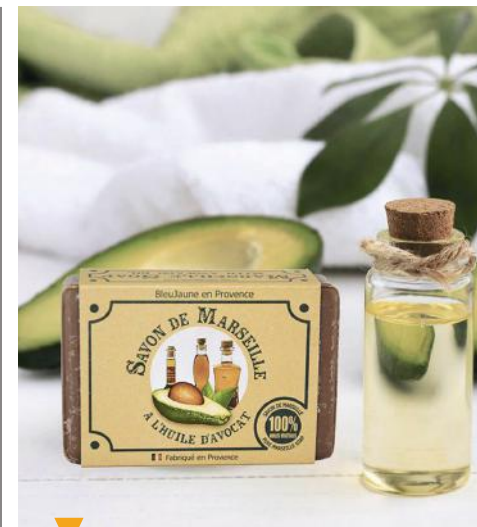
BLEU JAUNE EN PROVENCE - PLAN D'ORGON

4 place Le Cours | +33 (0)6 24 05 15 87 contact@santonscristinedarc.fr santonscristinedarc.fr Cristine façonne depuis 10 ans un univers composé de sujets épurés, aux couleurs et aux formes généreuses, gourmandes. Une interprétation unique, empreinte de poésie... L'absence de peinture sur les visages est une porte ouverte pour l'imaginaire. Tout est réalisé ici, dans l'intimité de l'atelier de