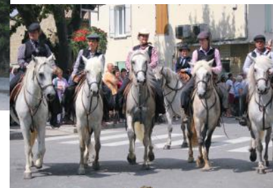
ROGNONAS - SAINT ELOI