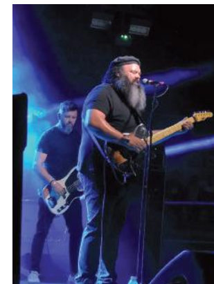
CABANNES LES NUITS DU BLUES