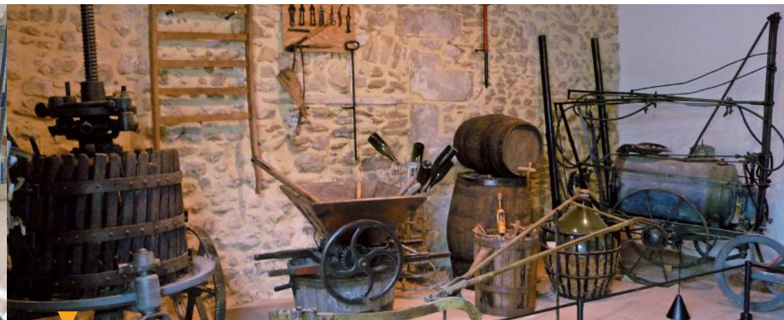
MUSÉE DES OUTILS AGRAIRES ET DES TRADITIONS - CHATEAURENARD