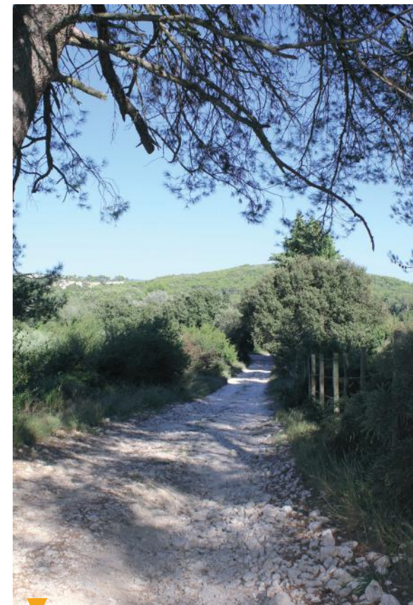
BOUCLE CYCLOTOURISTIQUE N° 3 (PAGE 32)

Ce parcours vous emmènera à la découverte de Noves sur les traces de son patrimoine naturel et historique. D'église en chapelle, de colline en points de vue, vous arpentez les rues de la commune, les chemins du petit massif forestier du Rougadou ainsi la Petite Crau sur la trace des oratoires, des croix, de la flore, et des fontaines qui marquent les points forts et les symboles de l'histoire de la commune.