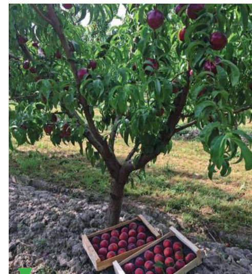
LE POTAGER D'ÉMILIE - CABANNES