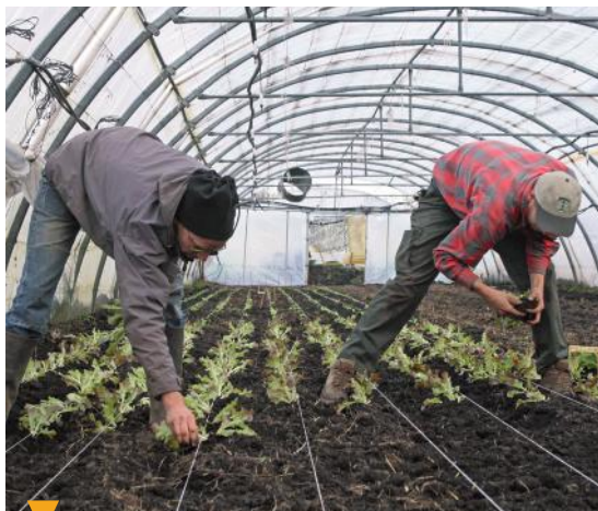
LE JARDIN DU PAPET - MOLLEGES

Chemin du Vallat neuf RN 7 | +33 (0)4 88 61 36 65 www.produceurs-du-sud.business.site Producteur de fruits et légumes de saison cultivés en pleine terre de manière raisonnée. Certifié Global Gap 2018. Qualité, du stade de la plantation à la récolte, respect de la terre et valeur humaine, sont les maîtres mots qui nous animent au quotidien. Laitue, Tomate, Courgette, Aubergine, etc... sont cultivées chaque année et font le plaisir des clients, qui reconnaissent les atouts de cette démarche : fraîcheur, goût, équité.