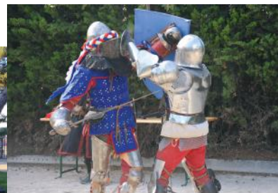
ORGON - FÊTE MÉDIÉVALE