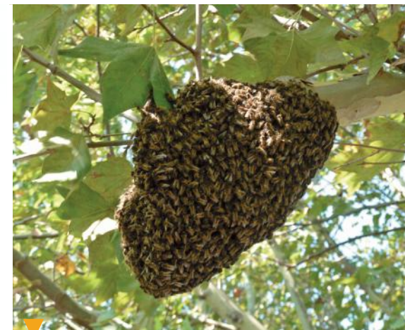
LE RUCHER D'AURIAC - CHATEAURENARD