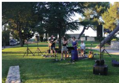
NOVES - LES MUSICALES