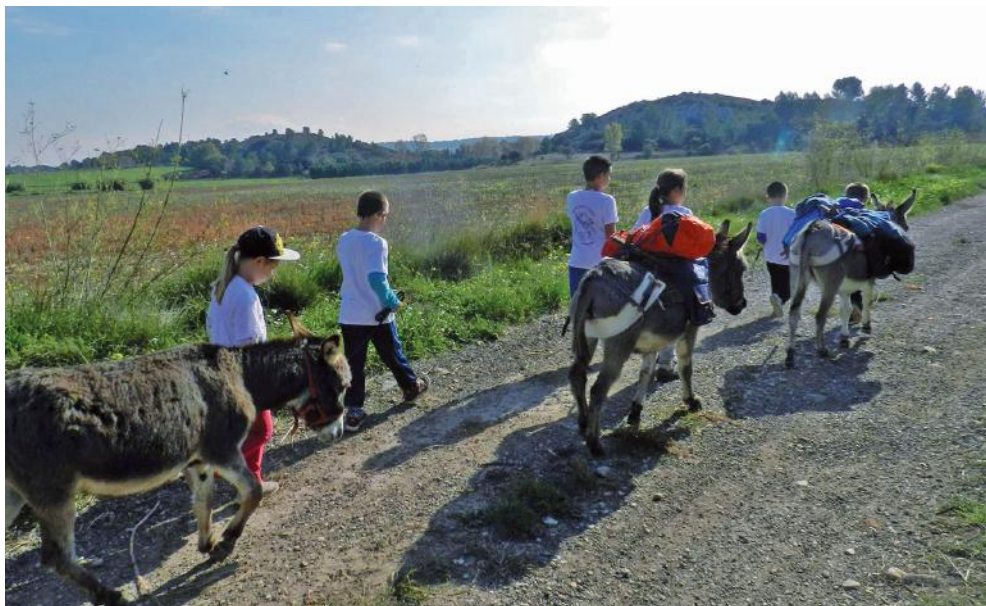
PTITS ANES - GRAVESON