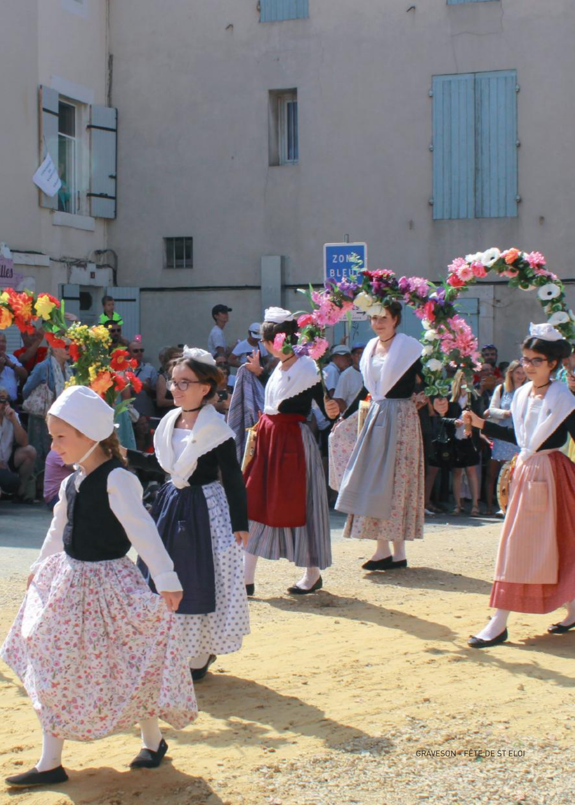
GRAVESON - FÊTE DE ST ELOI