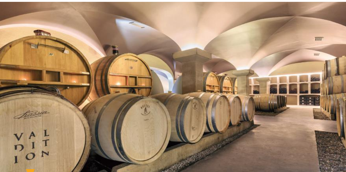
DOMAINE DE VALDITION - ORGON