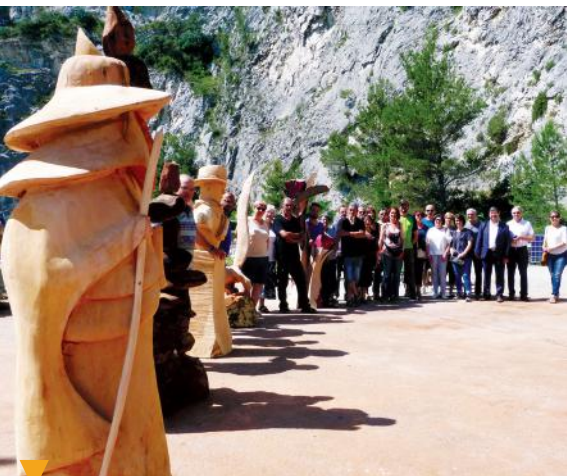
SCULPTURES EN BOIS - ORGON