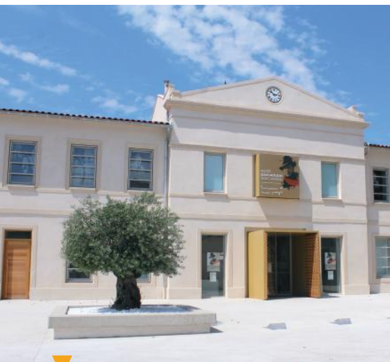
MUSÉE JEAN MOULIN - SAINT ANDIOL