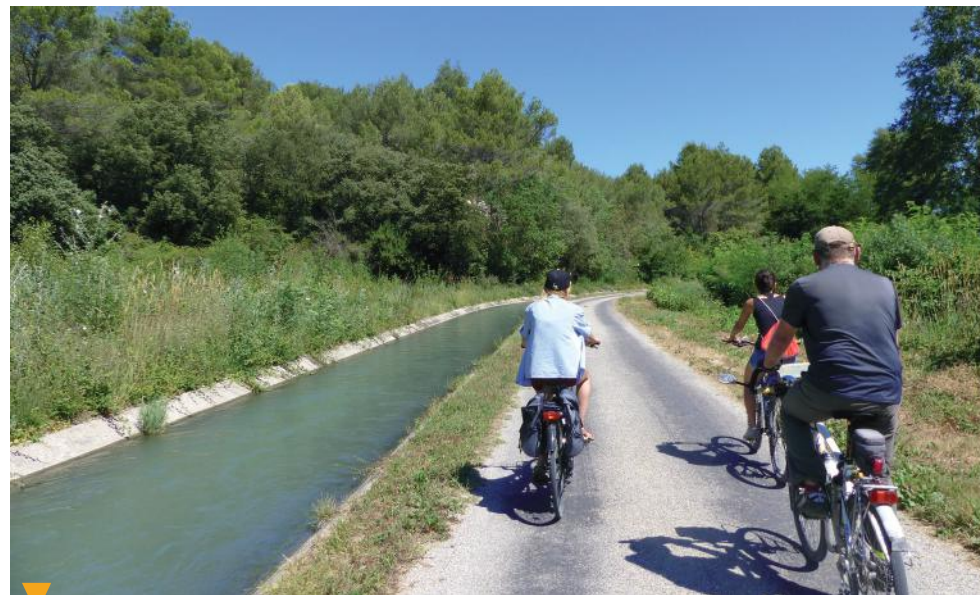
BOUCLE CYCLOTOURISTIQUE N° 3 (PAGE 32)

Boucle de 23 km, d'une durée de 2h30 et d'un niveau facile, entre Orgon, Mollégès et Plan d'Orgon. Ce circuit n'est pas conseillé pour les vélos de routes car certains chemins ne sont pas goudronnés.