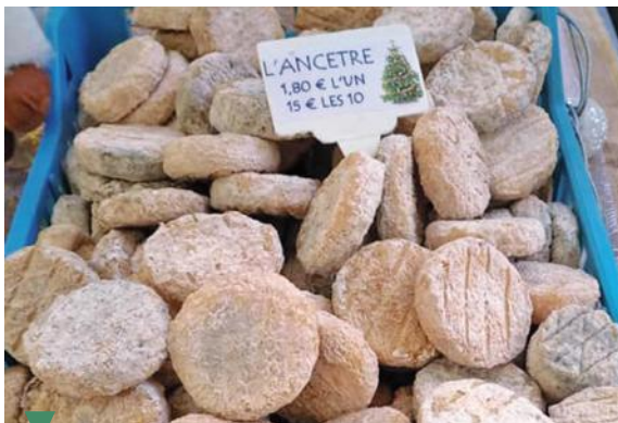
FERME DU SÉGALON - GRAVESON

Production de Fromages de chèvres. Vente à la ferme ou sur Arles le samedi matin et Graveson le vendredi après-midi de mai à octobre.