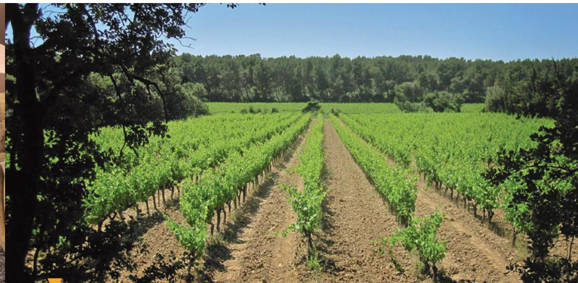
DOMAINE DE DÉVÈS - NOVES